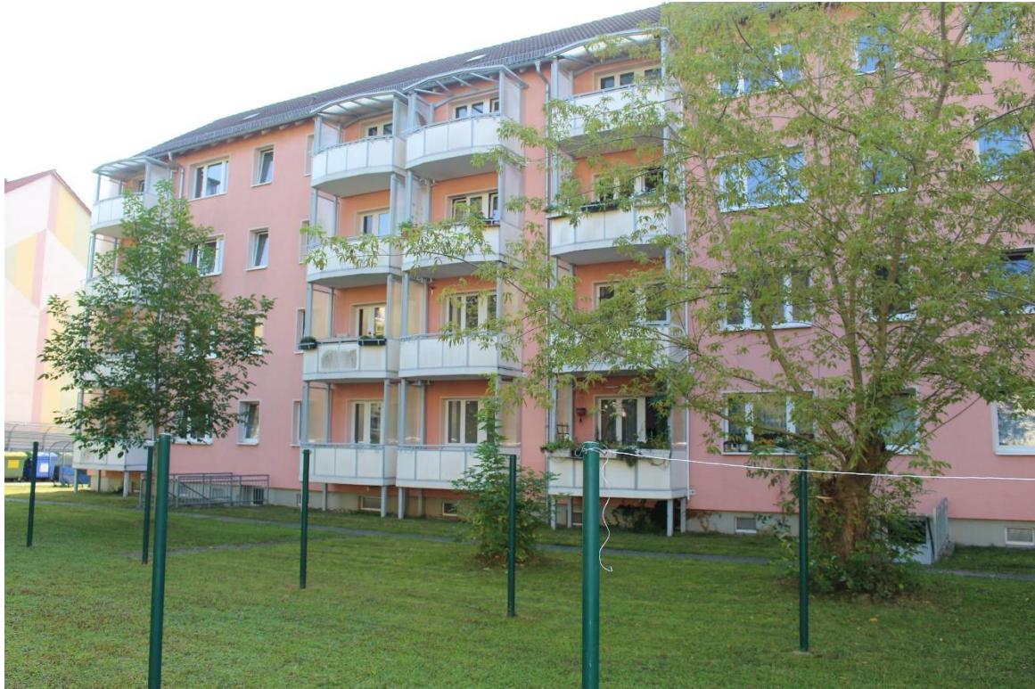
Balkon mit Blick ins Grüne